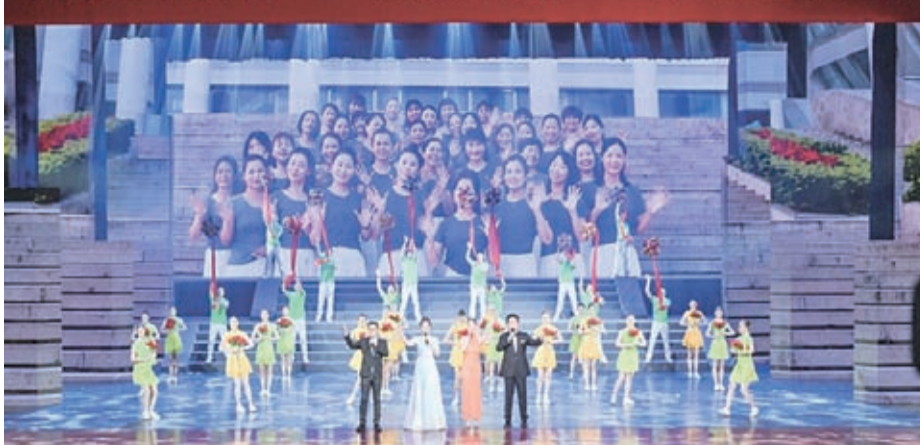
文藝晚會開場歌舞《常來常樂》

“我們希望通過主題雕塑沉澱歷史、傳承文化，更好地展示長樂悠久深厚的歷史底蘊，彰顯獨具特色的人文精神，展現獨具魅力的城市品位，進一步堅定文化自信，增強吳航兒女對家鄉的認同感、自豪感、使命感。”長樂區相關負責人說。